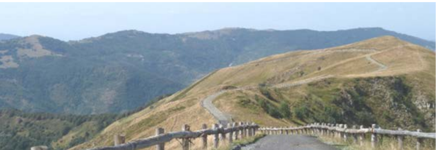
La foto di copertina è tratta dal sito internet della provincia di Pavia relativamente al SIC Le Torraie Monte Lesima